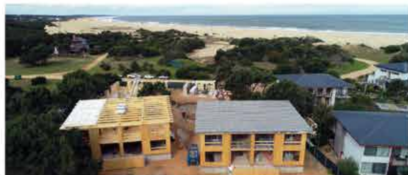
Anastasio Beach and Resort de José Ignacio

Siguiendo la línea de innovación en eficiencia energética y de la toma de decisiones inteligentes, nace el proyecto Anastasio. Este es el segundo proyecto de hotelería en madera creado de la mano de Enkel Group Uruguay, en el que también utilizamos las más eficientes tecnologías y la materia prima más noble que la naturaleza nos puede brindar.