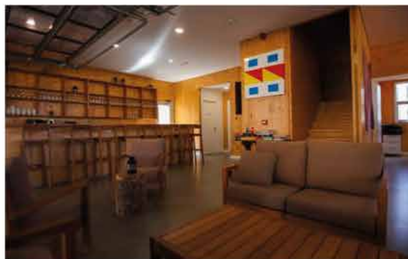
Posada José Ignacio (interior)