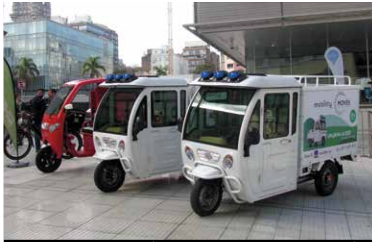
EMPRESAS: UTILITARIOS ELÉCTRICOS A PRUEBA SIN COSTO POR 30 DÍAS

Planes Institucionales de Movilidad Sostenible (PIMS): En el área metropolitana el 48% de los viajes son rutinarios (trabajar o estudiar). Dado que estos viajes comparten un destino común (la institución de trabajo o estudio), se