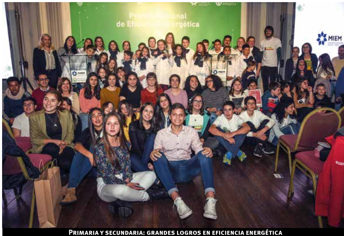
PRIMARIA Y SECUNDARIA: GRANDES LOGROS EN EFICIENCIA ENERGÉTICA

Premio: MEVIR. Se otorgó el premio por el compromiso en la mejora de la eficiencia energética en el diseño constructivo de más de 1000 viviendas en todo el país. Además, incorporó capacitación a los hogares y equipamiento eficiente, mejorando el confort con menor costo.