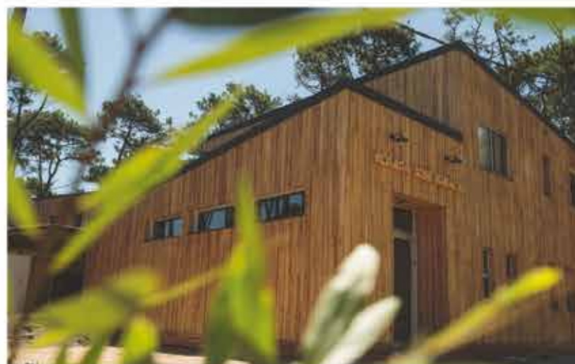
Posada José Ignacio (exterior)