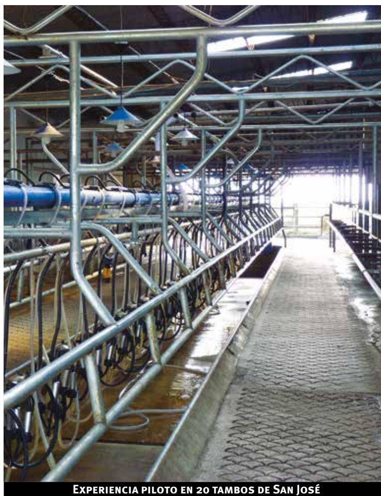
EXPERIENCIA PILOTO EN 20 TAMBOS DE SAN JOSÉ

El Piloto “Proyecto de Inversiones y Asesoramiento a tambos en eficiencia energética” tiene como