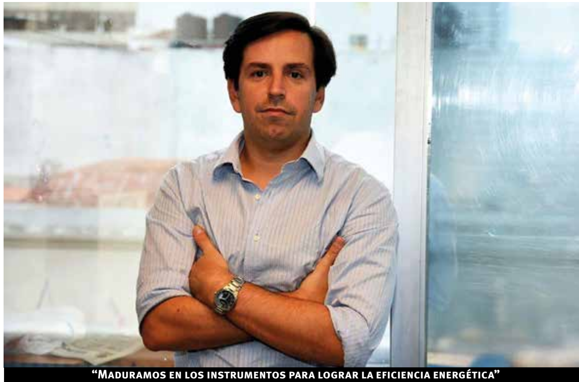
“MADURAMOS EN LOS INSTRUMENTOS PARA LOGRAR LA EFICIENCIA ENERGÉTICA”

Muchas veces los primeros trabajos condicionan el futuro laboral de uno. Este tema de la energía es tan amplio, que ocupa a personas con conocimientos de muchas especialidades. En la Dirección de Energía hay economistas, ingenieros, contadores, comunicadores, sociólogos, politólogos, entre otros. Esto se debe a que la lógica de los proyectos lo requiere así porque en realidad la energía es multidisciplinaria, tiene muchas aristas. Por ejemplo, cuando hablamos del impulso de la política