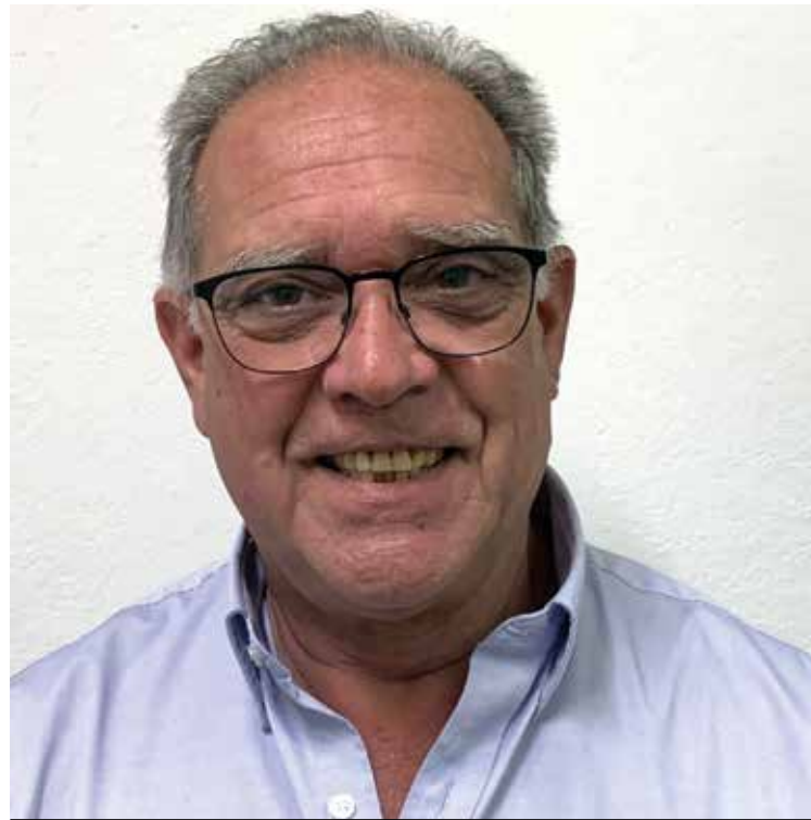
“ES IMPORTANTE QUE SE SEPA QUÉ HACEMOS EN EFICIENCIA ENERGÉTICA”