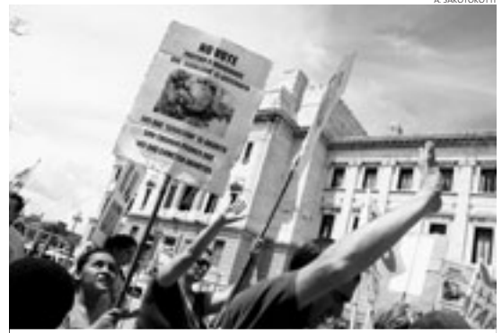
TRIUNFO. Los opositores al aborto lograron su objetivo de frenar la ley.

El veto a la despenalización será excepcional por la árida polémica que generó y porque el partido gobernante tiene mayoría parlamentaria. "Hay un debilita-